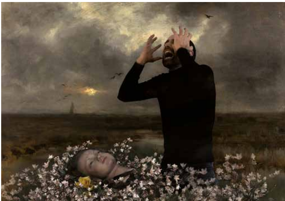
Visuel pour Frankenstein Antoine Blanquart

Porté par une équipe constituée d’une actrice, un acteur, une chanteuse, un pianiste, et aidé d’une foule de bustes, poupées, objets en tous genres, “Frankenstein” propose un kaléidoscope tout en finesse et contraste, lucidité et émotion, alliant texte, chants, musique, tapis sonore, corps... Un kaléidoscope qui ne peut qu’inviter à s’interroger sur ce que sont – ou devraient être ? – les limites humaines, en termes de justesse, de justice, de responsabilité et d’engagement.