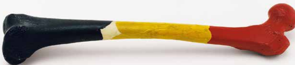
Marcel Broodthaers Fémur d'homme belge, 1964, os peint, 8x47x10cm

**« Un Juif n'a-t-il pas des yeux ? Un Juif n'a-t-il pas des mains, des organes, des dimensions, des sens, de l'affection, de la passion ; nourri avec la même nourriture, blessé par les mêmes armes, exposé aux mêmes maladies, soigné de la même façon, dans la chaleur et le froid du même hiver et du même été que les chrétiens ? Si vous nous piquez, ne saignons-nous pas ? Si vous nous chatouillez, ne rions-nous pas ? Si vous nous empoisonnez, ne mourrons-nous pas ? Et si vous nous bafouez, ne nous vengerons-nous pas ? » ( Shylock in Le marchand de Venise , Shakespeare)