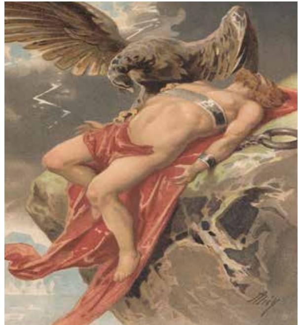
"Prométhée tourmenté", lithographie publiée en 1897 d'après une œuvre de Alexander Zick

Tout d'abord, Mary Shelley met son roman sous le signe de la mythologie grecque en ajoutant un sous-titre à son roman : Frankenstein ou le Prométhée moderne . Ce mythe existe sous plusieurs variantes, souvent présenté comme l'histoire du titan du nom de Prométhée qui vola le feu sacré de l'Olympe, celui qui apporte la métallurgie, et par métonymie la technique et les autres arts, pour le donner aux humains. Enragé par cet affront, Zeus condamne Prométhée à être attaché à un rocher, se faisant dévorer le foie par un aigle chaque jour, repoussant chaque nuit suivante. Métaphore de la connaissance scientifique, l'œuvre de Mary Shelley propose une critique des sciences modernes. Si nous faisons parfois référence à Prométhée, c'est pour prendre le contre-pied d'une critique réactionnaire, pour laquelle la connaissance est mauvaise en soi, Victor devant alors être puni pour son hybris. Nous n'en faisons pas pour autant l'éloge en montrant les choix désastreux du Docteur Frankenstein qui abandonne et méprise sa création dès sa « naissance ».